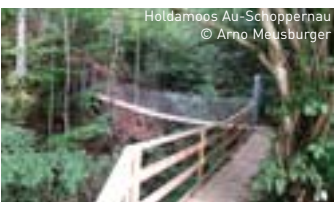
Holdamoos Au-Schoppertnau

Einblicke in die Naturgeschichte bieten die zahlreichen Naturlehrpfade und Natur-Themenwege, geologische Wanderwege (Bartholomäberg), geologische Besonderheiten und Naturdenkmäler, wie beispielsweise die Gipsdolinienlandschaft (Gipslöcher) bei Lech, der Quelltuff-Lehrweg in Lingenau, der Barfußweg in Bizau,