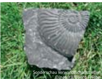
Sonderschau Verwandtschaftstreffen