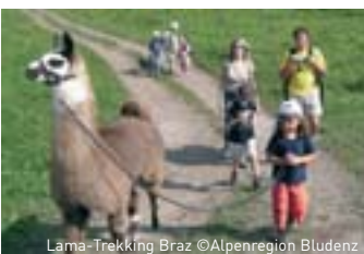
Lama-Trekking Braz