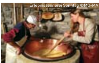
Erlebnissenerei Sonntag