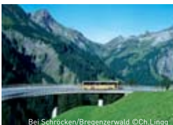
Bei Schröcken/Bregenzwald

Bus und Eisenbahn fahren sind ein besonderes Erlebnis für die ganze Familie. Für Kinder ist es viel lustiger, einen Ausflug mit dem Bus oder der Eisenbahn statt mit dem „ge-wohnten“ Auto zu unternehmen.